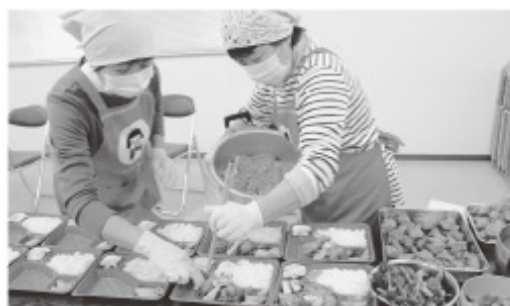
■女性部子ども食堂

また、助けあい活動や福祉活動などを通して地域の皆さまと交流を深め、豊かな社会づくりに貢献しています。