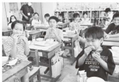
■学校給食への食材提供