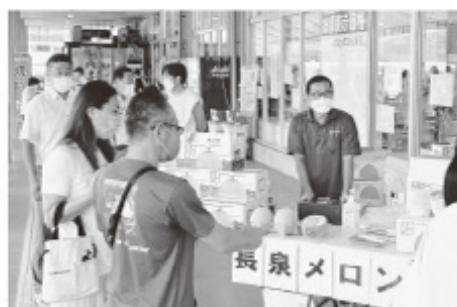
■管内農畜産物PR活動の様子