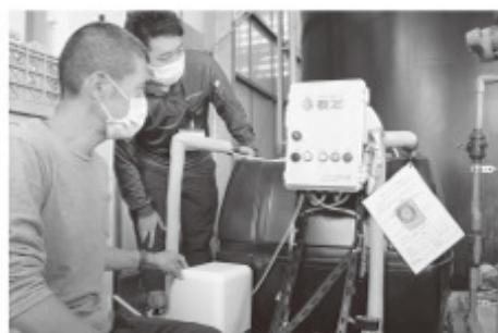
■伊豆の国商委員会ナノバブル水製造装置

消費者の信頼やニーズに応じ、安全・安心な農作物を食卓へお届け出来るよう、生産履歴の検証や残留農薬検査を実施し、安全性の確保に努めています。