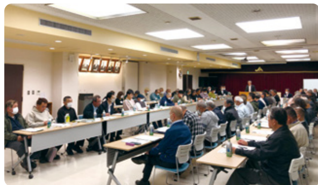
部農会長会議の様子

地区の正組合員数が減少する中、横のつながりを維持し、問題に連携して対応するため、各地区ごとに役員会も定期的開催し、関係の維持強化に努めます。