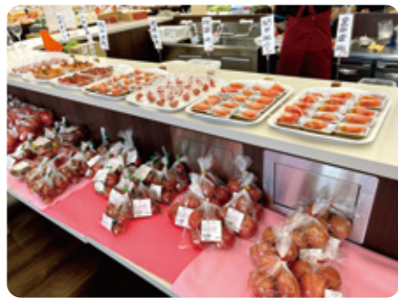
▲試食カウンターに並ぶ様々なトマト

みしまるかんでは、旬の野菜を紹介するイベントを随時開催しています。最新情報はインスタグラムでお知らせ中です。ぜひご覧ください。