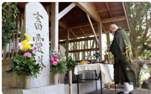
好物の野菜などを供え冥福を祈る

家畜への感謝と責任を忘れぬよう、慰霊祭は毎年執り行われ、公園の敷地内には馬頭観音や軍馬の慰霊碑も建てられています。