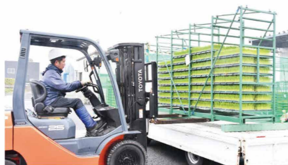
▲出荷苗を準備するJA職員

富士宮育苗センターでは、4月6日から5月中旬まで水稻苗4品種2万2000枚を出荷しました。