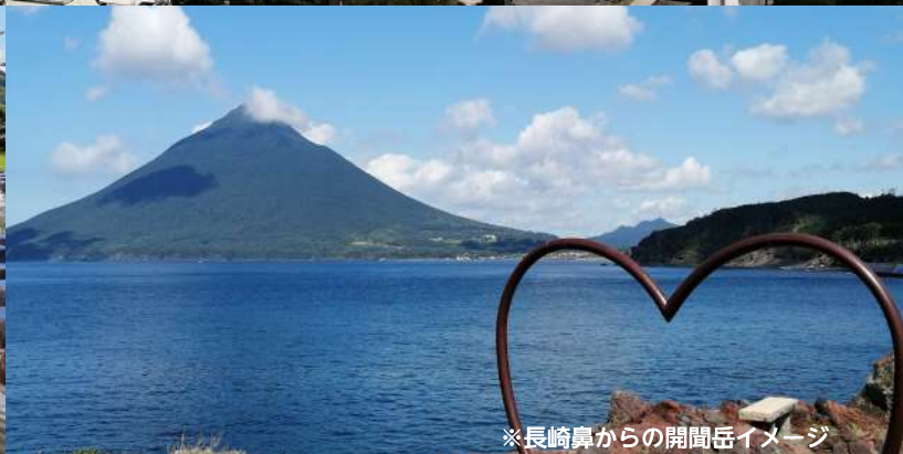
※長崎鼻からの開間岳イメージ