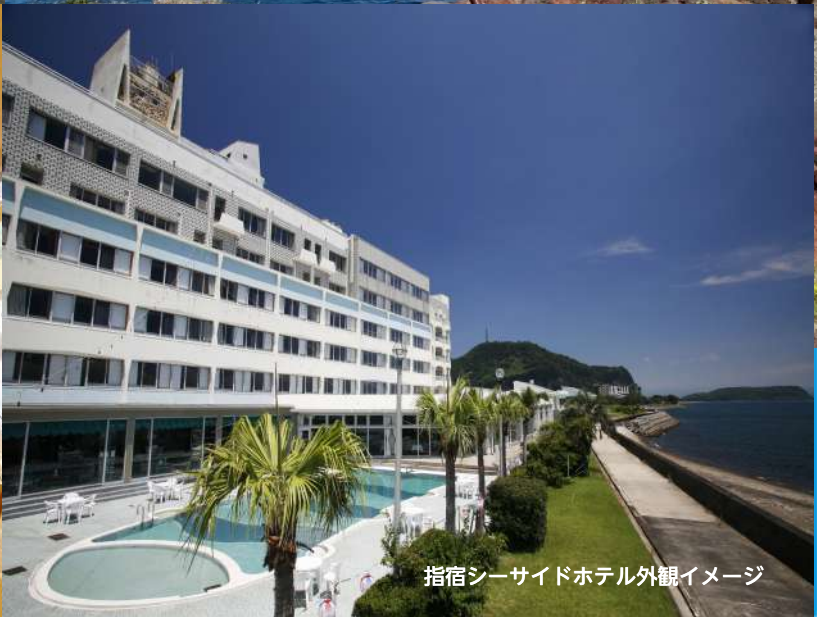
指宿シーサイドホテル外観イメージ