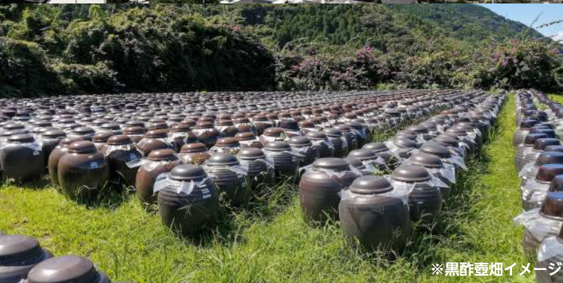
※黒酢壺畑イメージ