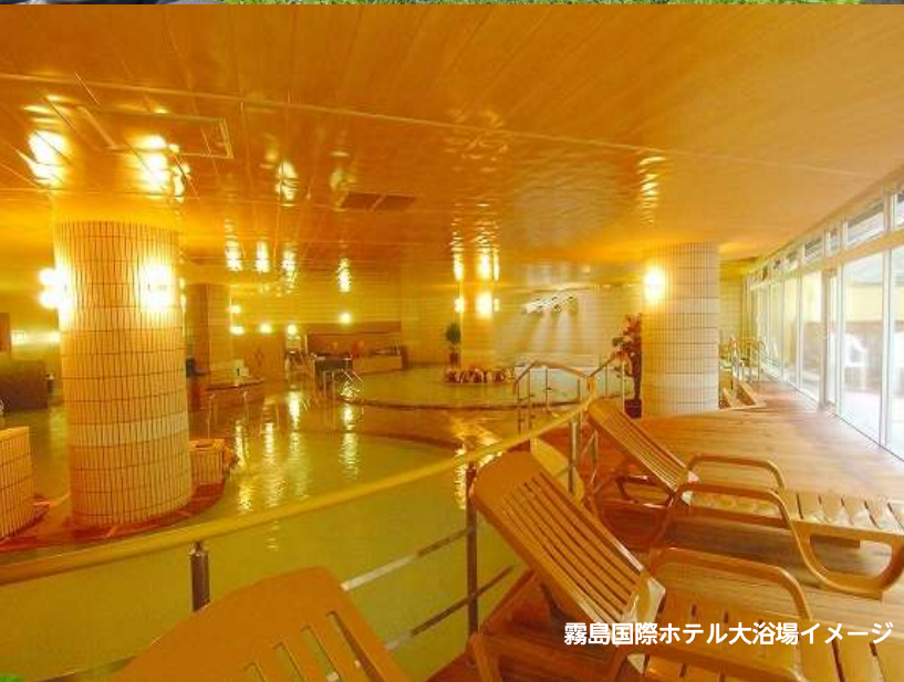
霧島国際ホテル大浴場イメージ