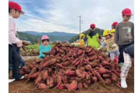
子どもたちが大きく育った三島甘藷を収穫

各所で豊作実りの秋を感じて 10月、11月に、三島市内各所の学校で名産サツマイモ「三島甘藷」の収穫体験が行われました。6月に子どもたちが植え付けたもので、サイズ、量ともに上々の豊作となりました。 11月5日には佐野小学校・伊豆佐野保育園で三島甘藷部会が収穫体験を実施。子どもたちには甘藷サポーター企業による支援金により、三島甘藷を使ったのっぺパンがプレゼントされました。16日には同サポーター企業の社員と家族が収穫体験をするなど、三島甘藷をもとに地域の輪が広がっています。