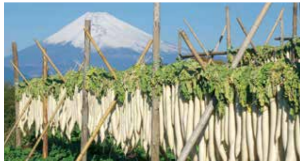
三島の冬の風物詩 大根干しの景観

三島函南地区では11月からたくあん大根の準備で「大根干し」が行われています。富士山をバックに白い大根がずらりと並ぶ光景は地元の冬の風物詩として有名です。12月21日(土)には昨年復活した「三嶋大根祭り」をみしまるかんで開催します。本年6月に施行された食品衛生法の改正に対応し、市内の老舗漬物店と提携してたくあん漬けを行っています。復活した伝統の味をぜひ味わってみてください。