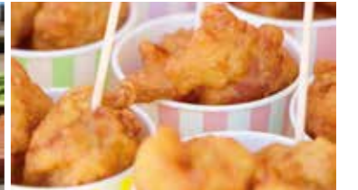
唐揚げ、焼き芋など出店