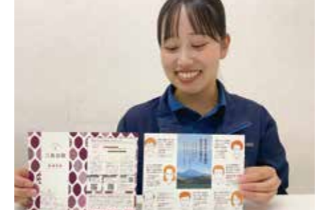
三島甘藷のリーフレットを紹介する職員

廃棄部分に新たな価値を 三島函南地区営農販売課は11月12日、エコプロジェクトから生まれた印刷紙「つぶすな紙」用の三島甘藷のツルを市内のほ場で収穫しました。 「つぶすな紙」とは(株)アイティエスが開発した、三島甘藷のツルを原料とした印刷紙です。自然素材ならではのナチュラルな色合いと柔らかい手触りが特長で、甘藷の茶色い繊維が混ざり、同じ繊維の配置は1枚も現れません。 ツルの収穫は2年に1度行い、今回は約2トンを収穫しました。同社の施設で加工され、三島函南地区営農販売課職員の名刺や三島甘藷のリーフレットなどに使用しています。