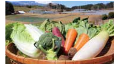
新鮮野菜の大売り出し