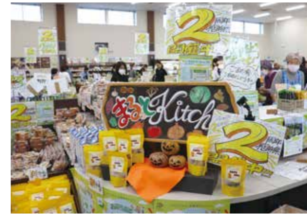
2周年でにぎやかな装飾がされた店内