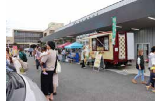
いろいろな出店が並んだサラダマーケット

みしまるまるっと サラダマーケットも同時開催 10月26日、27日、ファーマーズマーケット「みしまるかん」で2周年感謝祭を行いました。目玉商品として限定200セットの野菜の詰め合わせ「みしまるかんオリジナルバスケット」や、地元グルメ「みしまろquette」の販売、根菜を中心とした「三島汁」を無料配布しました。 併せて、地元小売店約15店舗が露店を出し、「みしまるまるっと サラダマーケット」を同時開催。キッチンカーや飲食店、スイーツ店や雑貨店なども軒を連ね、店外も多くの客でにぎわいました。 2日間で計2000人以上の来店客があり、オリジナルバスケットは約30分で完売。今後も多くのお客さまに楽しんでいただけるイベントを企画していきます。