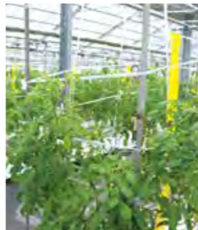
徹底した管理が甘みの秘訣