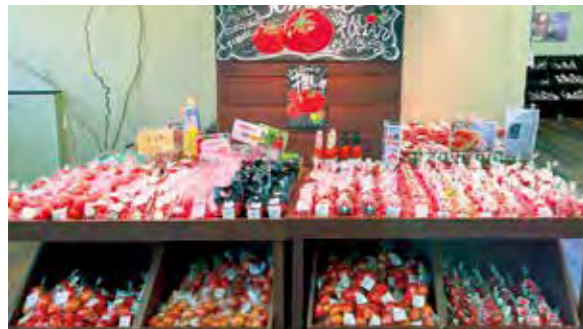
旬の時期にはみしまるかんに特設コーナーを設置

三島函南地区では「冬春トマト」の出荷が本格化しています。大玉トマトからミニトマトまで、各生産者が工夫を凝らした栽培方法でさまざまなトマトを育てています。養液栽培による高糖度トマト「三島の味カトマト」やGABA（ストレス緩和に効果があるアミノ酸の一種）を平均の2倍含む機能性表示食品「ミシマガチトマト」など、味わいや特長の異なるトマトがあります。お気に入りのトマトをぜひ見つけてみてください。5月末ごろまで出荷は続く予定です。