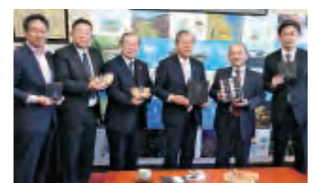
ブランド設立を三島市長に報告する 柿島地区本部長(右)

旅行ニーズを意識して開発したもので、11月29日に、JR三島駅構内(北口)にリニューアルオープンした小売店「PLUSTA(プラスタ)」1号店内に常設ショップを設置。三島を代表するお土産として、観光協会箱根西麓三島野菜ブランド推進協議会など市内の関係各所が一丸となり作り上げた自慢の商品を扱います。現在、三島甘藷を使ったフィナンシェ「三島甘藷ほろり」と三島馬鈴薯を使ったスイーツポテト「三島馬鈴薯キャラメルスイーツポテト」を販売中です。新商品も開発中とのこと。