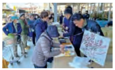
多くの来店者でにぎわう「三嶋大根祭り」

歴史と伝統を復活させ、次世代へつなぐ 12月21日、ファーマーズマーケット「みしまるかん」で「三嶋大根祭り」を開催し、1500人の来店者が訪れました。同イベントは約10年前に惜しまれながらも幕を閉じた「箱根大根祭り」を新たな形で昨年から復活開催したもので、ブランド「箱根西麓三島野菜」のリブランディングを進めるとともに、歴史と伝統あるたくあん大根干しの景観を、農業資源として次世代に受け継ぎます。