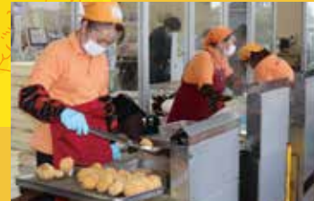
みしまコロッケの販売

みしまるかんは10月に3周年を迎え、感謝の気持ちを込めて10月25日・26日に「3周年祭」を行いました。新鮮な採れたて野菜の販売の他、限定200セットの「旬の農産物詰め合わせセット」やみしまコロッケの販売、「三島汁」の無料配布などのイベントを行い、1800人以上の来場客でにぎわいました。 みしまるかんでは、今後も旬の野菜をPRするイベントを開催し、地場農産物の魅力を発信していきます。イベント等の最新情報はインスタグラムをご覧ください。