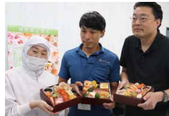
完成した「吉祥富士」を紹介する関係者ら

株式会社ティーケーシー(静岡工場・函南町)は、三島函南地区営農販売課が提供した同地区の農産物を使ったおせち「吉祥富士」を販売しました。 地域活性化を目的に企画し、日本の伝統食文化であるおせちを通じて、地元農産物の魅力を広く発信。同課が「三島馬鈴薯」や「ニンジン」など4品目を提供しました。加えて、丹那牛乳や伊豆産イチゴジャムなどの県内産の食材も使われ、47品目を盛り込んだ3段重おせちを、300食限定でイオンの公式オンラインショップで販売しました。