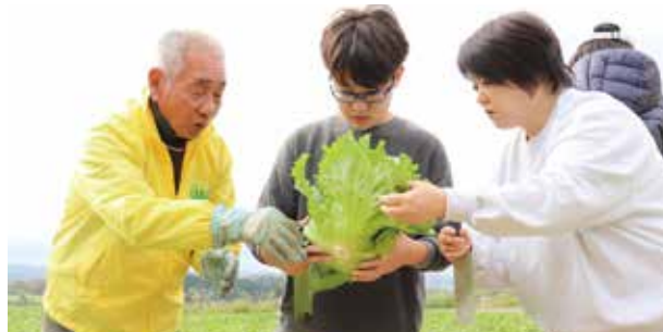
生産者から収穫の仕方を教わる参加者

三島レタスの魅力を広める 三島レタス収穫体験開く 三島函南地区営農販売課とマックスバリュ東海は11月8日、三島レタス組合協力のもと、収穫体験を笹原地区のほ場で開きました。 これは「三島レタス」のファンを増やそうと開いたもので、マックスバリュ東海のLINE会員で、募集があった21人が参加。一般募集での開催は初で、「三島レタス」の特長や栽培のこだわりを生産者が説明しながら、1人5玉を収穫しました。体験後は「三島レタス」の「レタしゃぶ」が提供され、新鮮な味わいを堪能しました。 参加者は「三島に移住し、「三島レタス」の甘さや食感に感激して今回参加した。生産者から直接話を聞くことができ、より「三島レタス」のファンになった。また生産者につながる機会があれば嬉しい」と好評でした。