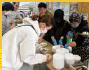
根菜をふんだんに使用した三島汁のサービス