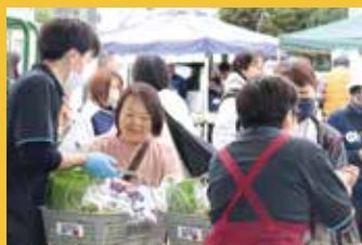
開店前から行列ができた「旬の農産物詰め合わせセット」の販売