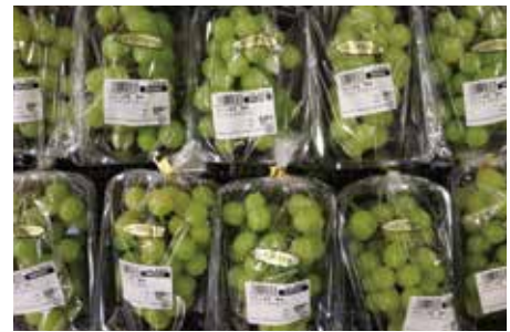
店頭に並んだ函南町産シャインマスカット

三島レタスの魅力を広める 三島レタス収穫体験開く 三島函南地区営農販売課とマックスバリュ東海は11月8日、三島レタス組合協力のもと、収穫体験を笹原地区のほ場で開きました。 これは「三島レタス」のファンを増やそうと開いたもので、マックスバリュ東海のLINE会員で、募集があった21人が参加。一般募集での開催は初で、「三島レタス」の特長や栽培のこだわりを生産者が説明しながら、1人5玉を収穫しました。体験後は「三島レタス」の「レタしゃぶ」が提供され、新鮮な味わいを堪能しました。 参加者は「三島に移住し、「三島レタス」の甘さや食感に感激して今回参加した。生産者から直接話を聞くことができ、より「三島レタス」のファンになった。また生産者につながる機会があれば嬉しい」と好評でした。