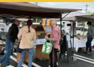
サラダマーケットの様子