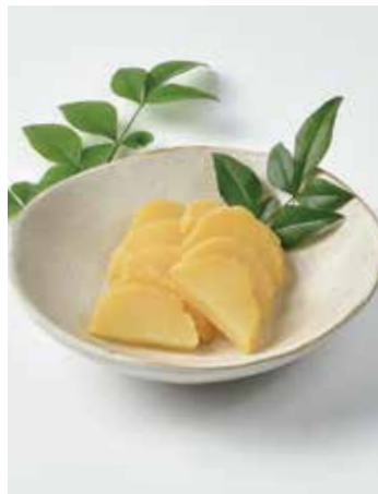
三島大根のたくあん