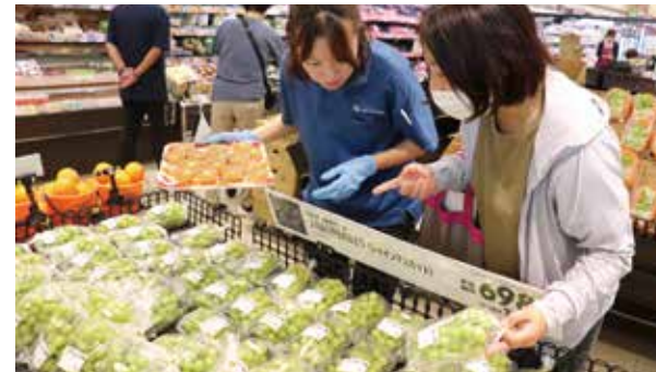
来店客に特長や魅力を伝える職員

特販課は9月12日、マックスバリュ長泉中土狩店と熱海店で、函南町産シャインマスカットの試食販売会を初めて開きました。 県東部のマックスバリュ21店舗には、当JA管内の農産物コーナー「じものコーナー」を設置しています。同コーナーのPRと消費拡大を目的に、旬を迎えた函南町産シャインマスカットを300パック用意し、職員が試食販売を行いました。来店客が実際に味わい、甘さなどを確かめることで購入につなげ、通常販売の10倍を売り上げるほどの大盛況でした。今後もさまざまな地場農産物の試食販売を行い、PRと消費拡大に努めていきます。