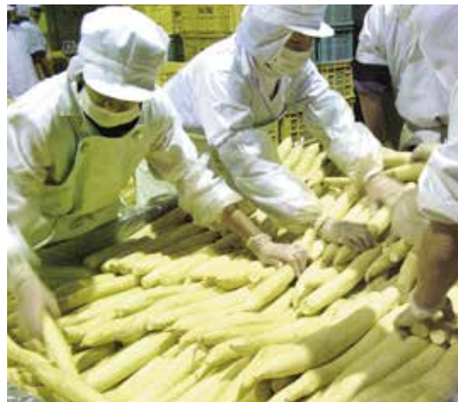
三島大根をたくあんに加工

「三島大根」は、箱根西麓三島野菜（通称：坂もの野菜）として、三島市坂地区を中心に栽培されています。たくあんに適した品種が生産され、大根を干す「干し大根がくや」の景観は、100年以上もの時を経て、多くの人々に冬の訪れを感じさせる古き良き日本の風景です。