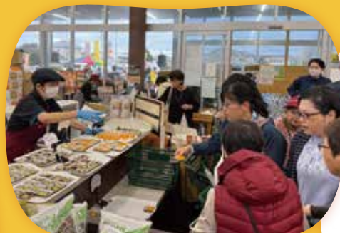
紅はるかやコリンキーなどが並んだまるっとキッチンコーナーで試食販売

みしまるかんは10月に3周年を迎え、感謝の気持ちを込めて10月25日・26日に「3周年祭」を行いました。新鮮な採れたて野菜の販売の他、限定200セットの「旬の農産物詰め合わせセット」やみしまコロッケの販売、「三島汁」の無料配布などのイベントを行い、1800人以上の来場客でにぎわいました。 みしまるかんでは、今後も旬の野菜をPRするイベントを開催し、地場農産物の魅力を発信していきます。イベント等の最新情報はインスタグラムをご覧ください。