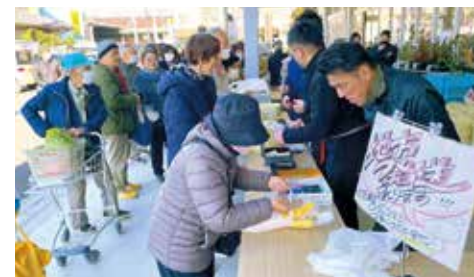
昨年のみしまるかん会場の様子

大好評の「三嶋大根祭り」を今年も開催します。 みしまるかんと三島スカイウォークの2会場で行います。 皆さまのご来場をお待ちしております。