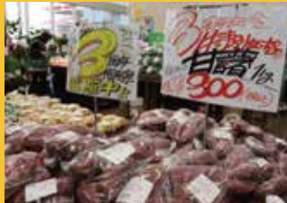
特別価格で販売した人気の三島甘藷