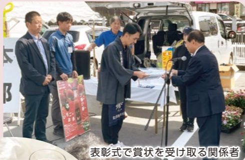
表彰式で賞状を受け取る関係者

ソーダ or 牛乳割り、 アイス or ヨーグルトに かけて食べるのがオススメ!