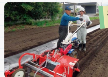
5月下旬 落花生の種まき 9月下旬 収穫

この実証に続き、9月下旬からは新たにキャベツの栽培試験もスタート。栽培を続けながら、収穫した落花生を使い地元の菓子店などと商品開発を検討しています。