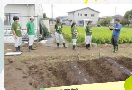
9月下旬 キャベツ苗の植え付け

アサヒ飲料富士山工場の製造過程で出た茶かすの他、野菜、コーヒーかすなどを合わせた100%植物由来のフレンド堆肥。