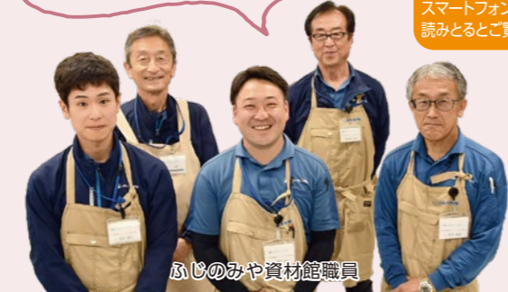
ふじのみや資材館職員