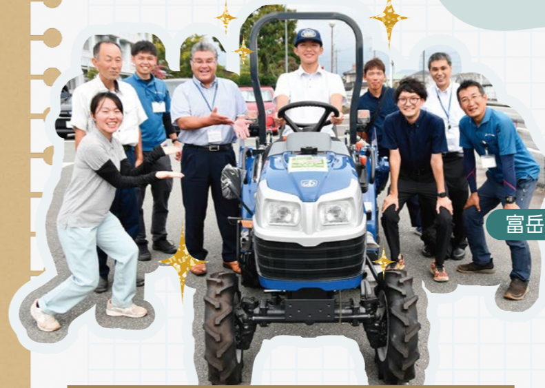
トラクターを前に記念撮影(学校関係者とJA職員)