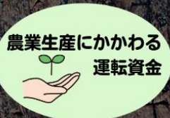
農業生産にかかわる 運転資金