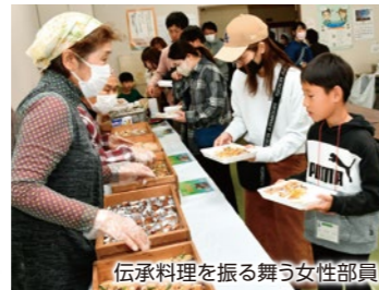
伝承料理を振る舞う女性部員