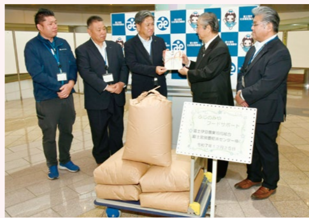
太田会長(右から2人目)へ目録を手渡す佐野地区本部長(右から3人目)