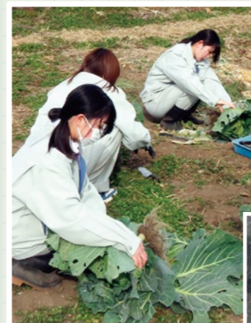
▲キャベツを収穫する生徒