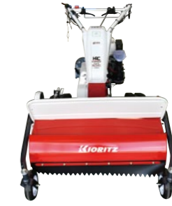
NEW 自走式ハンマー ナイフモア