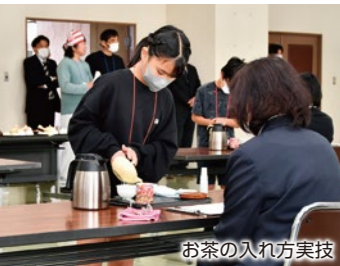
お茶の入れ方実技