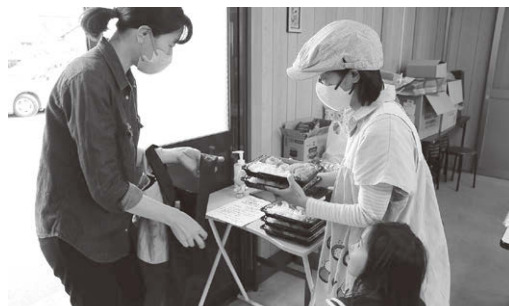
■女性部子ども食堂

また、助け合い活動や福祉活動などを通して地域の皆さまと交流を深め、豊かな社会づくりに貢献しています。