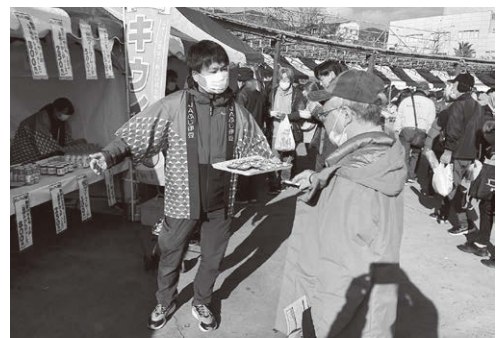
■管内農畜産物PR活動の様子