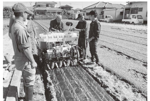
■あぐりチャレンジ事業・自動定植機導入