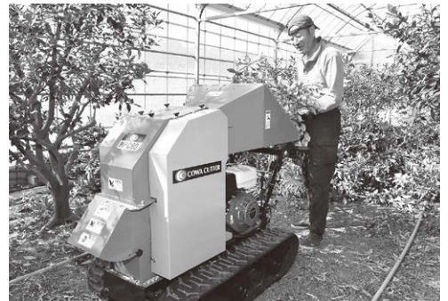
■あぐりチャレンジ事業・マルチパワーカッター導入

消費者の信頼やニーズに応じ、安全・安心な農産物を食卓へお届け出来るよう、生産履歴の検証や残留農薬検査を実施し、安全性の確保に努めています。