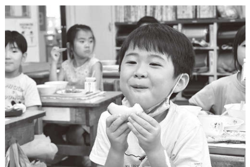
■学校給食への食材の提供