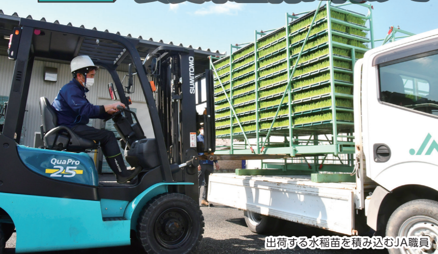
出荷する水稻苗を積み込むJA職員