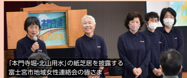
「本門寺堀-北山用水」の紙芝居を披露する富士宮市地域女性連絡会の皆さま