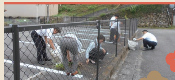
支店周辺の美化活動