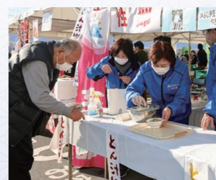
管内の野菜がたっぷり入った女性部の豚汁