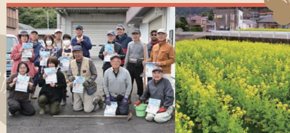
西豆地区の皆さんと遊休農地を活用した菜の花の種まき。土肥桜の咲く頃、1月下旬以降が見頃