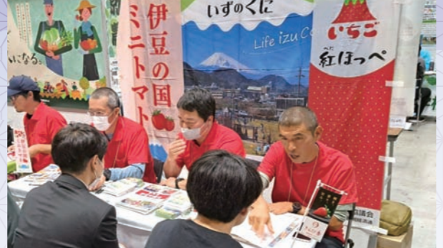
東京・大阪の就農相談イベントに出展