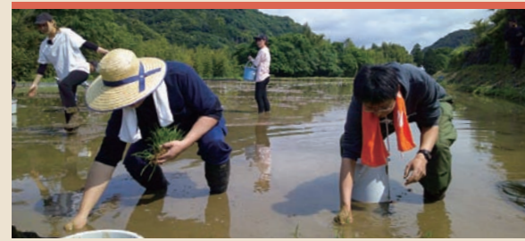
田んぼアートやお月見コンサートなど地元イベント運営に協力