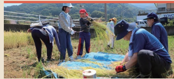
戸田森林組合主催の戸田小中一貫校の稲刈りに協力