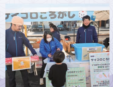
野菜や米を景品にしたサイコロ転がし