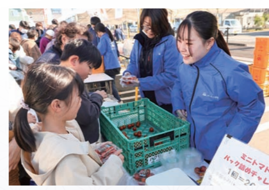
ミニトマトのバック詰めチャレンジ

伊豆の国地区JAまつり2025を12月7日、伊豆の国地区本部駐車場で開催しました。当日は約3000人が来場。特産のミニトマトや乾シイタケ、小坂ミカンを使った企画ブースや原木シイタケ・ワサビの試食、米「伊豆の恵」・イチゴの販売、餅まきなど多彩なイベントを実施し、大盛況となりました。大勢の皆さまのご来場ありがとうございました。