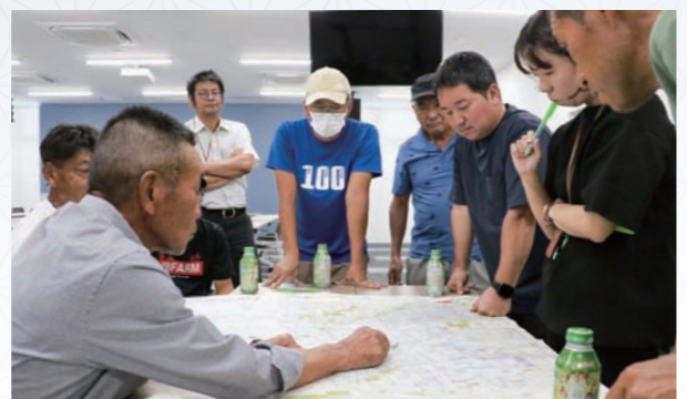
ハウス建設候補地マップを作成