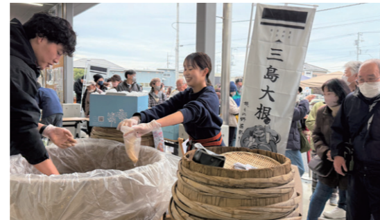
直径1mのたるに漬けた「三島大根」たくあんの販売

みしまかんでは、地元漬物店3店による「三島大根」のたくあん販売や三島市が大根の産地として知られるぎつかけになった三島農兵節演舞を行い、来場者は1000人を超える盛況となりました。三島スカイウォークでは、地元飲食店が「三島大根おでんフェス」を開いた他、同市の冬の風物詩である干し大根の白いカーテンを再現したフォトスポットを設置し、多くの観光客が足を止めて撮影を楽しみました。今後も地域の伝統をPRするイベントを企画し、魅力を発信していきます。