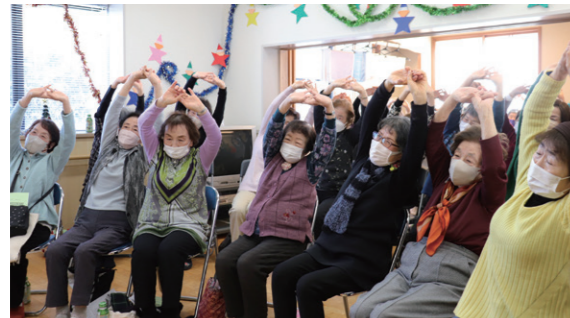
大勢が参加し交流を深める

同施設では日頃、体操教室など教室ごとに活動していますが、年に数回は利用者全体で行事を行い、交流を深める場を設けています。同会では、参加者全員でクリスマスソングなど15曲を歌った後、体操で体を動かしました。その他、JA職員による「よさこい」の披露やビンゴ大会を行い、会場は終始笑顔と歓声に包まれました。今後も利用者同士が交流を深められる機会を設けていきます。