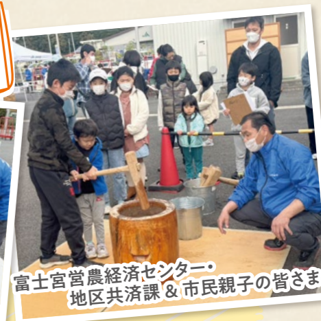
富士宮営農経済センター・地区共済課 & 市民親子の皆さま