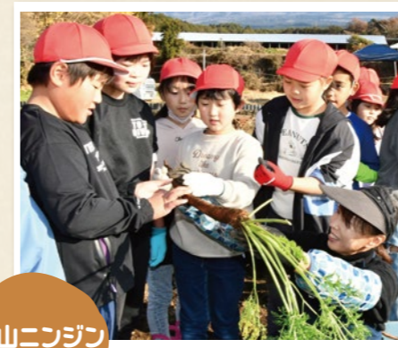
村山ニンジン収穫