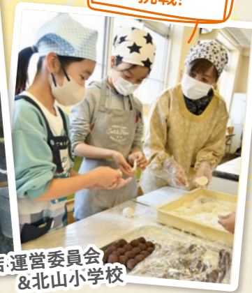
北山支店・運営委員会 & 北山小学校