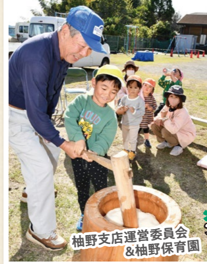
柚野支店運営委員会 & 柚野保育園

営農経済センターや支店では地域の農家組合員の皆さまの協力も得て、11月～12月にかけてさまざまな食農教育活動を行いました。