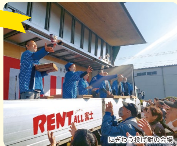
にぎわう投げ餅の会場