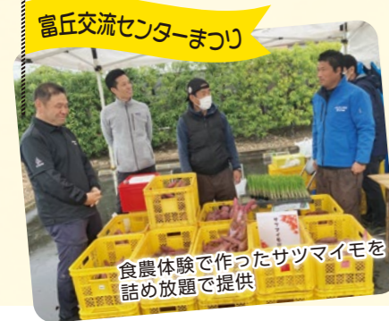
富丘交流センターまつり