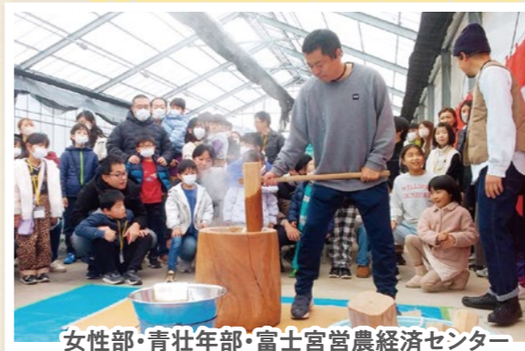
女性部・青壮年部・富士宮営農経済センター & 富士宮市PTA連絡協議会