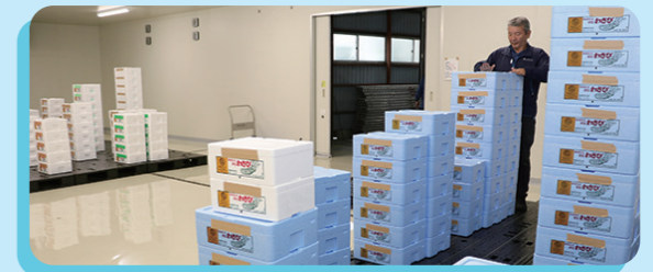
大型の冷蔵倉庫でワサビの品質を保持

J Aでは生産組織の意見を反映した品目別振興計画を作成し、農家組合員の農業所得向上に取り組んでいます。主目的のワサビでは、コールドチェーン化を進めるため、修善寺営農経済センターの経済倉庫内にプレハブ冷蔵倉庫を建設し、10月から本格稼働を開始しました。庫内温度は約10℃で、ワサビの品質低下を防ぎます。各地区の出荷用冷蔵庫から保冷車で集荷、新設の冷蔵倉庫で分荷を行い、産地から市場まで一定の温度を保つことで高品質なワサビの高単価販売と販路拡大につなげていきます。