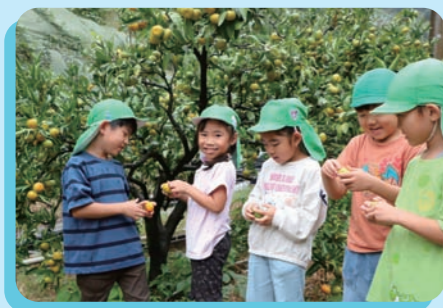
開園式でミカンを味わうにじろも園の園児たち