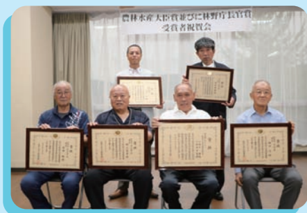
各品評会受賞者の皆さま