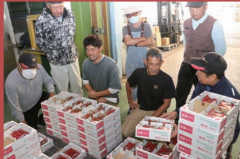
イチゴ初出荷の様子