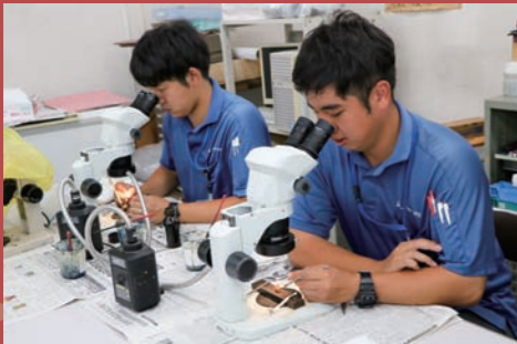
イチゴの適期定植をサポートするための花芽検鏡