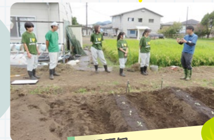
9月下旬 キャベツ苗の植え付け

アサヒ飲料富士山工場の製造過程で出た茶かすの他、野菜、コーヒーかすなどを合わせた100%植物由来のフレンド堆肥。