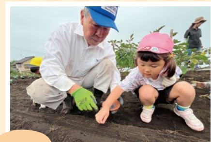
冬野菜 種まき 柚野支店運営委員会 & 柚野保育園

営農経済センターや支店では地域の農家組合員の皆さまの協力も得て、9月～10月にかけてさまざまな食農教育活動を行いました。