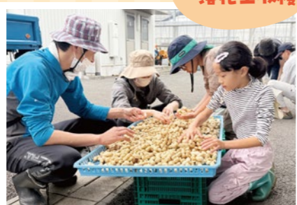
サツマイモ& 落花生収穫 富士宮営農経済センター・ 地区共済課&市民親子の皆さま