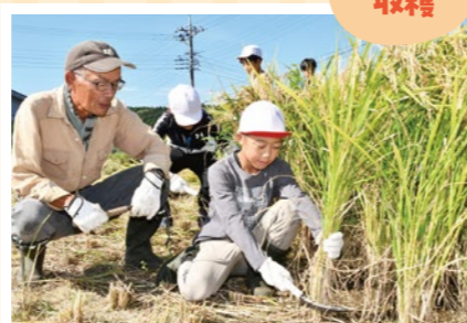
もち米 収穫 北山支店運営委員会 & 北山小学校