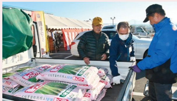
※写真は昨年の様子。当日の販売品は、昨年と異なる場合があります。

特売品の日替わり商品、農業機械の展示会など各種催しを予定しています。詳しい内容は1月に発行する新聞折り込み広告、または1月以降のJAふじ伊豆ホームページ、資材館のフェイスブックをご覧ください。