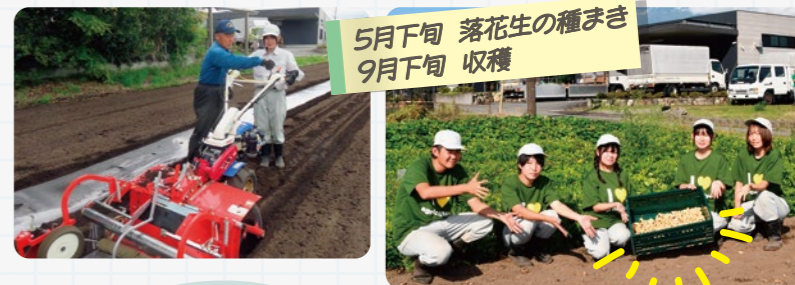
5月下旬 落花生の種まき 9月下旬 収穫

この実証に続き、9月下旬からは新たにキャベツの栽培試験もスタート。栽培を続けながら、収穫した落花生を使い地元の菓子店などと商品開発を検討しています。