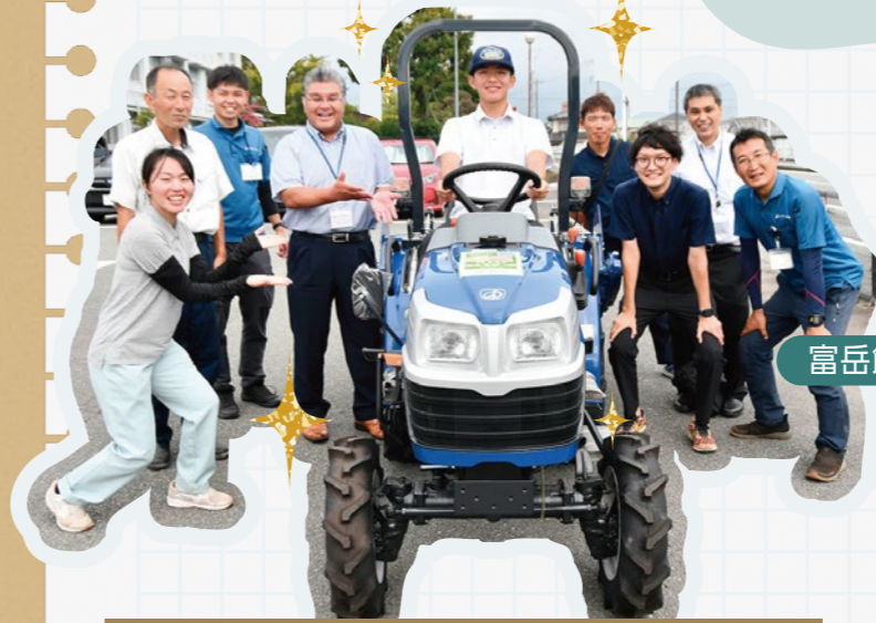
トラクターを前に記念撮影(学校関係者とJA職員)

8月29日に引渡しが行われ、富士宮営農経済センター職員が操作や点検方法を説明。生徒からは「農業人口の減少や学ぶ場の少ない中、実習用に貴重な機械をいただきとてもうれしい。大切に使いたい」と喜びの声が聞かれました。機械は実習で活用されています。