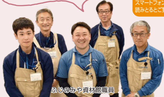
ふじのみや資材館職員