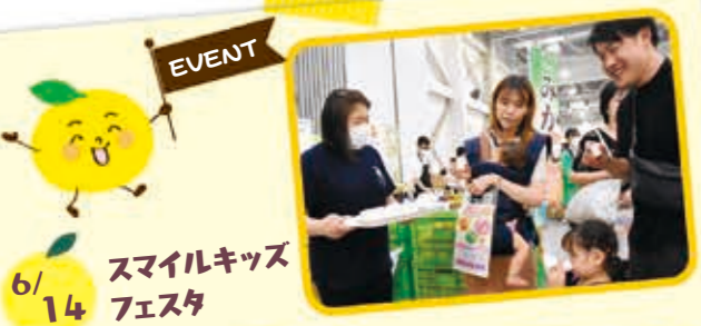
6/14 スマイルキッズフェスタ

河津農産加工所は、管内のファーマーズマーケットや直売所の他、さまざまなイベントに参加し、ニューサマーオレンジドリンクの試飲イベントを行いました。