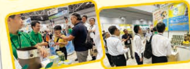
7/22~7/24 三菱食品ダイヤモンドフェア 東京ビックサイトで開催された三菱食品ダイヤモンドフェアではニューサマーオレンジの果汁を使用した新商品を全国の加工業者や販売元に紹介しました。