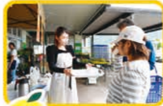
7/12 農の駅グリーンプラザ 伊豆の国