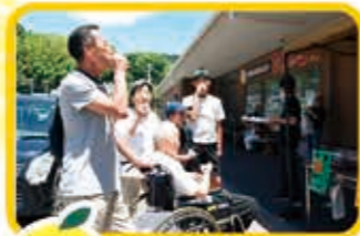
6/22 稲取漁港直売所 こらっしえ