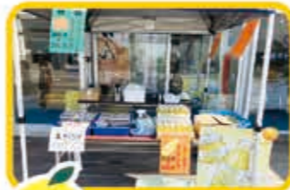
7月毎週土曜日 ベイステージ下田 JA直売センター