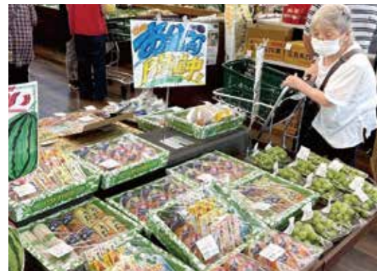
フェア限定で販売した詰め合わせセットが人気

みしまるかんで「お盆フェア」開催 フルーツや夏野菜が勢ぞろい 「みしまるかん」は8月9日から11日、お盆フェアを開きました。 スイカやモモなどのフルーツの他、「三島とつもろこし」や「箱根枝豆」などの夏野菜を多数販売し、3日間で1800人を超える来店客でにぎわいました。 お供え物や贈答用として販売した詰め合わせセットは「何種類も入っていて豪華、親戚にぜひ送りたい」と人気を集め、フルーツを購入した来店客は「お盆で親戚が集まる際に、地元産のおいしい農産物でもてなしたい」と好評でした。