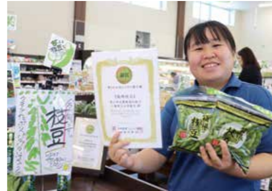
「箱根枝豆」を紹介する営農アドバイザー

「箱根枝豆」が銅賞 第4回全国えだまめ選手権 三島函南地区のブランド枝豆「箱根枝豆」が、日本野菜ソムリエ協会が7月23日に開いた「第4回全国えだまめ選手権」で銅賞を受賞しました。優しい甘みとしっかりとした食感のバランス、後味の良さが評価されました。 同選手権は、価値ある青果物や加工品を世の中に広め、日本の農業の活性化に寄与することが目的で行われています。全国から25種の枝豆がエントリーし、評価員が産地情報などを伏せた完全味覚評価で審査。評価員全員の合計点で賞が決定しました。