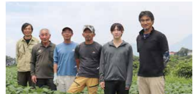
銅賞を受賞した枝豆出荷組合の組合員