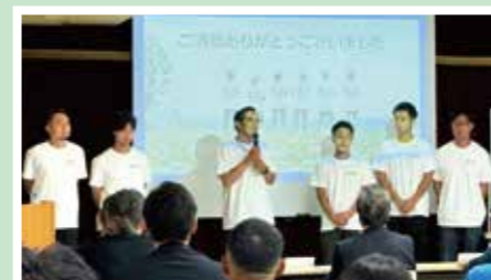
「箱根西麓のうみんず」メンバー