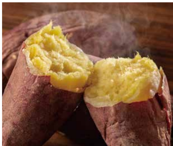
強い甘みと味の濃さが焼き芋にピッタリ

実りの秋がやってきました。三島函南地区では、箱根西麓の良質な土壌で育てられた「三島甘藷」の出荷が始まっています。甘くて味が濃いのが特長で「しずおか食セレクション」や「三島ブランド」に認定されています。ほくほくとした味わいの「紅あずま」、しっとり甘みが強い「紅はるか」、きめ細かく滑らかな舌触りの「シルクスweet」の3品種があり、さまざまな味わいを楽しむことができます。焼き芋やスイーツなど、多くの調理方法で秋ならではのおいしさをお楽しみください。