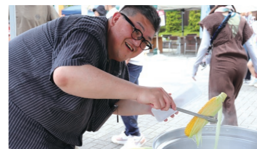
購入した「三島とうもろこし」をゆでる来場客