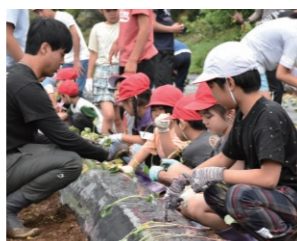
甘藷つる挿し 三島市坂幼稚園・坂小学校