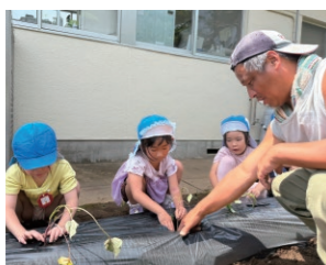
甘藷つる挿し 三島市松本幼稚園

三島函南地区の各組織・生産者が、管内の園児・児童を対象に食農教育活動を行っています。出前授業では、箱根西麓三島野菜について紹介しました。