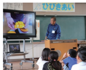
三島市長伏小学校