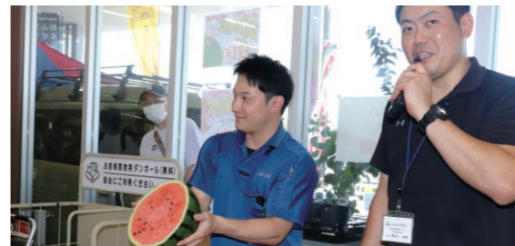
中身の割れの有無を当てる職員

来店客からは「甘くてシャリシャリしておいしい」、「スイカをたたき、微妙な音の差で中身の割れの有無を当てて見事だった」と好評でした。