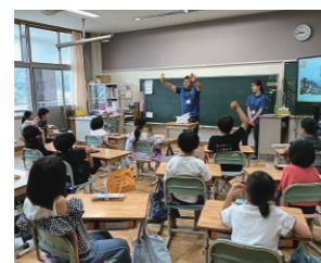
三島市佐野小学校