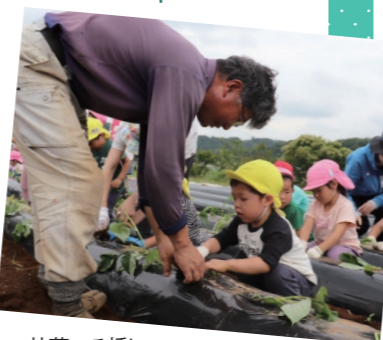
甘藷つる挿し 三島市佐野保育園・佐野小学校