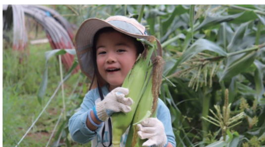
甘いと大人気の「三島とうもろこし」を収穫体験

7月5日、「三島とうもろこし」のファンイベントとして、収穫体験を前島農園のほ場で開きました。「みしまるかん」で応募があった15家族限定で実施。普段は経験できない早朝のほ場から見る景観、鳥や虫の声を聴きながら、旬を迎えた「三島とうもろこし」の収穫を体験しました。その他、トウモロコシのクイズやプチ情報講座、採れたてそのままの生の味わいとゆでたての食べ比べを通じて、産地化に向けたPRを行いました。参加者は「クイズを通して「三島とうもろこし」について深く知ることができた。生のままでも十分な甘さがあり、とてもおいしかった」と好評でした。