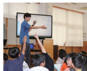
三島市錦田小学校