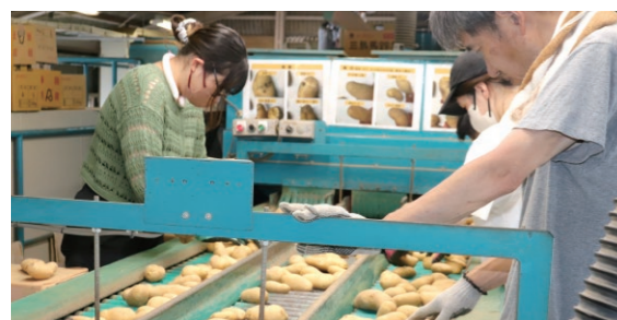
選果場では人の目で厳しく選果

6月25日から「三島馬鈴薯」の出荷が始まりました。今期は、夜温の低さや長雨などで栽培初期の生育不良が心配されましたが、生産者の細かな管理により、例年同様に上々の品質に仕上がっています。8月中旬までに、近在市場や首都圏へ約300トンを出荷する予定です。量販店だけでなく、ギフトや通販サイトなどでの販路拡大も目指します。しっかりとした舌触りとホクホクの食感、濃厚でコクのある「三島馬鈴薯」をお届けできるよう徹底した出荷管理を行っています。