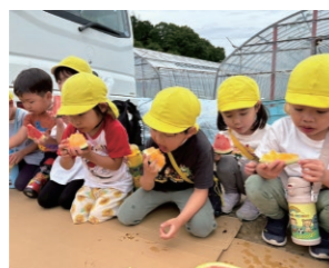
スイカ収穫・試食 函南町ひまわり保育園