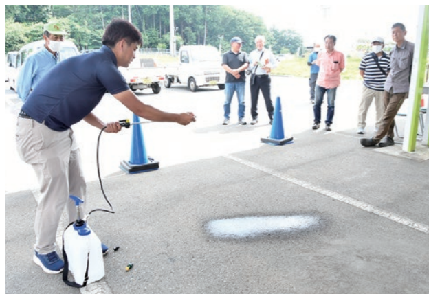
▲水を使ってノズルの散布実演

富士宮地区購買課は6月20日、本格的な雑草害シーズンを前に対策を周知しようと、JAポータルやファーマーズシステムを用いて参加者を募り、「除草剤講習会」を開きました。