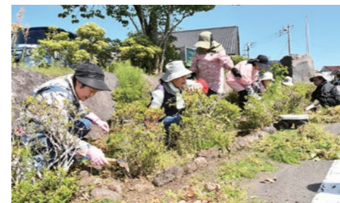
▲草取りに励む部員