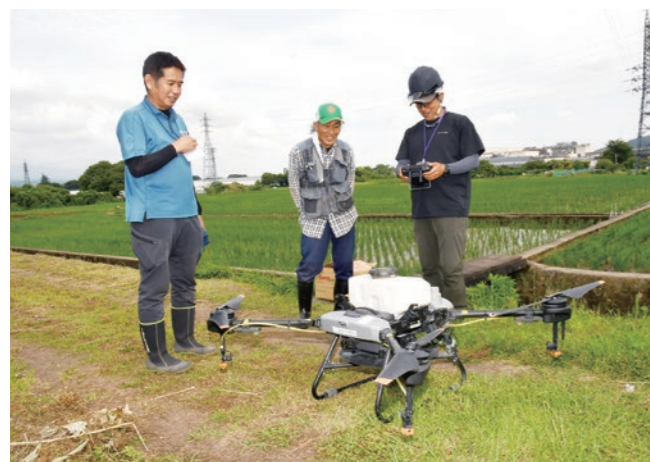
▲JA職員と提携事業者からドローンの説明を受ける生産者

富士宮営農経済センターと富士宮市では、本年度からスマート農業の活用にかかる費用の一部を助成(補助)する富士宮地区独自事業を始めました。