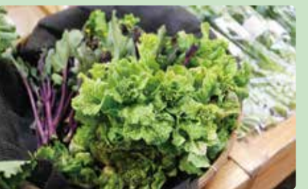
種類豊富なナバナが並ぶ

アブラナ科のつぼみや若葉、花茎を食べる緑黄色野菜ナバナ。ファーマーズ御殿場では、水かけ菜や弘法菜、紅葉菜などの地元産が3月下旬ごろまで並びます。つぼみならではのほろ苦さと甘み、食感が魅力。水かけ菜のつぼみ漬けは入荷待ちになるほど人気です。