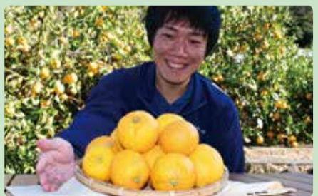
レモンとミカンを交配して誕生したレモネード

3月は沼津市特産の「西浦レモネード」が旬です。レモンのような爽やかな風味とミカンのような優しい甘さが特長で、そのまま食べるのがおすすめです。3月13日から15日は「西浦レモネードまつり」を開催し、金岡産直市、KAU〜、長泉産直市、すそのふれあい市で販売します。