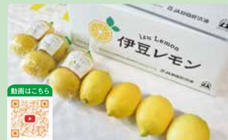
今年1月に誕生したレモンの新ブランド

JAふじ伊豆の新ブランド「伊豆レモン」の販売が始まり、いど湯っこ市場などのファーマーズマーケットの店頭に並んでいます。