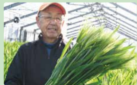
穂の立ち姿が美しく輝く花麦

河津町・西伊豆町・松崎町で、鑑賞用大麦「花麦」の出荷が最盛期を迎えています。若葉色の美しく揺れる穂が、春の訪れを感じさせます。縁起の良い花言葉を持ち、ひな祭りのフラワーアレンジメントや生け花の花材として人気です。県内外の生花店で販売されています。