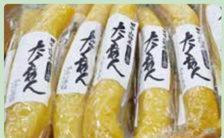
手作業で漬け込んだたくあん

伊豆の国市特産の「田中山たくあん」が農の駅グリーンプラザ伊豆の国・農の駅伊豆で販売中です。寒暖差のある環境で育ったダイコンを丁寧に漬け込み、地域の伝統の味として親しまれています。ポリポリの歯応えや噛むほどに広がるダイコンの甘みをお楽しみください。