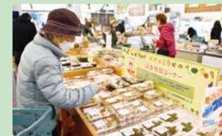
選ぶ楽しさもある多彩な品ぞろえ

う宮〜には、JA女性部員や地元飲食店など25軒が出荷する総菜や弁当が並びます。そば、煮物、オムライス、マーボー豆腐など、和洋中の豊富さが魅力です。「富士宮やきそば」をはじめ、豆もちや大福なども好評で、早い時間に品薄となるほど人気です。