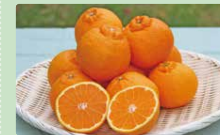
皮がむきやすく果汁たっぷりの甘さ

温暖な気候に恵まれた富士地区で育った不知火は、しっかりとした甘みと爽やかな酸味が重なり、果汁あふれるおいしさが口いっぱいに広がります。販売は3月下旬ごろまで、ファーマーズマーケットや富士地区の産直市(一部店舗)に並びます。旬の今だけの味わいを、ぜひお楽しみください。