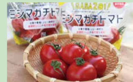
うまみに加え機能性も期待できるトマト

三島市で生産の「ミシマガチトマト」は、一般的な栽培方法のトマトに比べ栄養素GABA(ギャバ)を約2倍含む機能性表示食品で、濃厚な甘みとほのかな酸味が調和した味わいです。GABAにはストレスや疲労感を和らげる働きが期待されています。みしまるかんで3月下旬ごろまで販売中です。