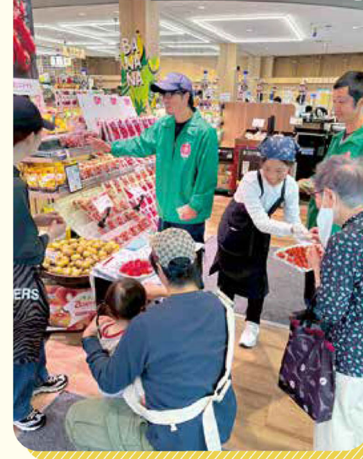
「伊豆の国ミニトマト」やイチゴが並ぶ青果コーナーで生産者がPR